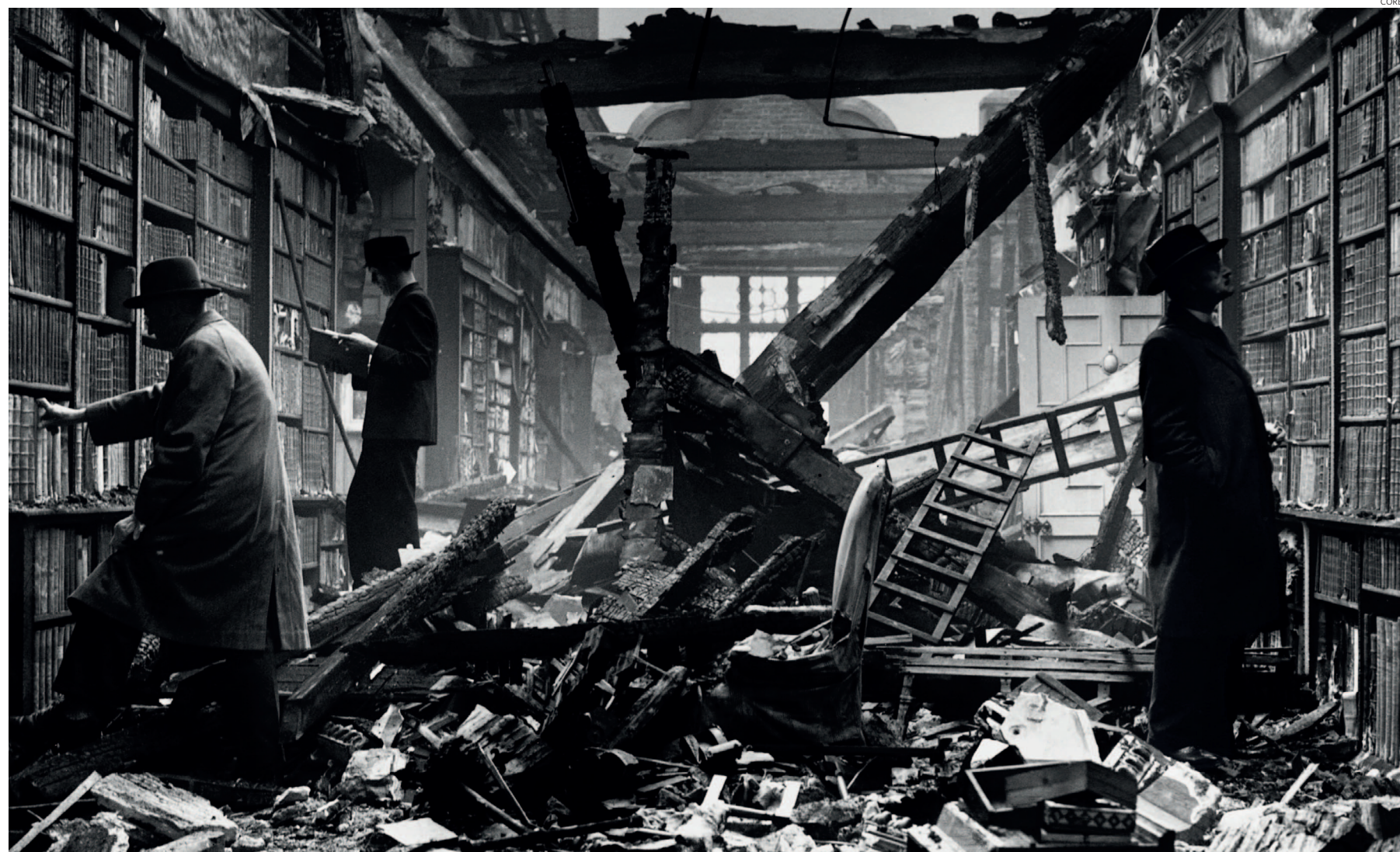
LA CULTURA RESISTE E RINASCE TRA LE MACERIE | La Holland House Library di Londra distrutta dai bombardamenti aerei nel 1940. Dinanzi a uno scenario simile (Milano, 1942-43, il Poldi Pezzoli in pezzi) Alberto Savinio, in «Ascolto il tuo cuore, città», annotava: «Sopra il portone del numero 30 di via Brera, questa insegna: Impresa Pulizia Speranza. Che aggiungere? È detto tutto».

Anche la crisi del nostro dopoguerra, a ben vedere, fu affrontata investendo in cultura. Le nostre città,