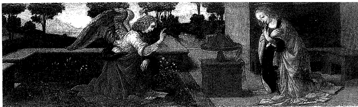
Louvre L'Annunciazione fu realizzata nel 1478. Un'altra versione dell'Annunciazione è al Museo degli Uffizi a Firenze

Santo Il San Giovanni Battista di Leonardo custodito al Louvre tornerà a Milano in occasione dell'Expo. Era già stato prestato a Natale 2009