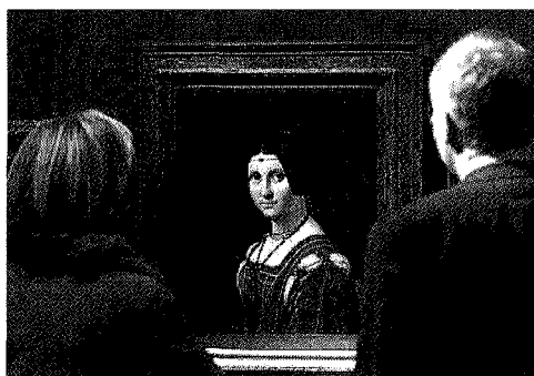
Ritratto La Belle Ferronière, il ritratto di dama con lo sguardo sfuggente dipinto da Leonardo tra il 1490 e il 1495 durante il suo primo soggiorno milanese