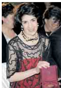
NEODIRETTORE Fabiola Gianotti

E queste tecnologie sono state trasferite ad altre discipline, all'industria e, di conseguenza, hanno avuto un impatto sulla vita di tutti i giorni. «Grazie agli studi effettuati per scoprire il bosone di Higgs - sottolinea Gianotti - sono state affinate importanti tecnologie che oggi vengono utilizzate, ad esempio, per immagazzinare l'energia solare nei pannelli e anche per scopi medici: penso all'acceleratore nucleare che, nel centro di adroterapia Cnao, aperto proprio a Pavia, serve a curare i tumori». Spesso Lhc è associato al concetto di antimateria che, a primo acchito, potrebbe