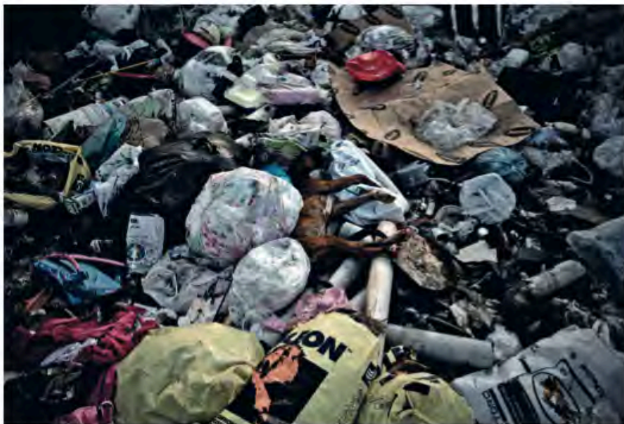
UNA DISCARICA CLANDESTINA AD ACERRA, DOVE SI ACCUMULANO RIFIUTI DOMESTICI E SCARTI INDUSTRIALI

ma le procedure adottate sono quelle certificate negli Usa. Oppure la causa potrebbe essere nascosta nel ventre delle discariche. Un dubbio che solo gli investigatori italiani possono risolvere.