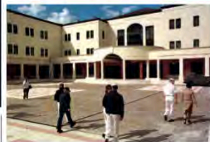
LA BASE STATUNITENSE DI CAPODICHINO E, A SINISTRA, ROGHI DI RIFIUTI A GIUGLIANO (NAPOLI)

contribuito alla situazione di Napoli". IL MALE LIQUIDO. La diagnosi più angosciante riguarda l'acqua (vedi tabella a pag. 43) e certifica quanto sia profondo il male nelle falde. Il 92 per cento dei pozzi privati che riforniscono le case costituiscono "un rischio inaccettabile per la salute". Ma ci sono minacce anche negli acquedotti cittadini: esce acqua pericolosa dal 57 per cento dei rubinetti esaminati nel centro di Napoli e dal 16 per cento a Bagnoli. Come è possibile che pure la rete idrica pubblica sia inquinata? Gli americani esaminano le 14 sorgenti che alimentano le città, tutte in ottime condizioni. Le tubature però sono vecchie,