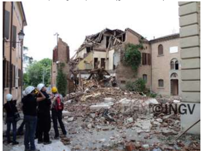
Foto 8. San Felice sul Panaro Crollo edificio di tipo A