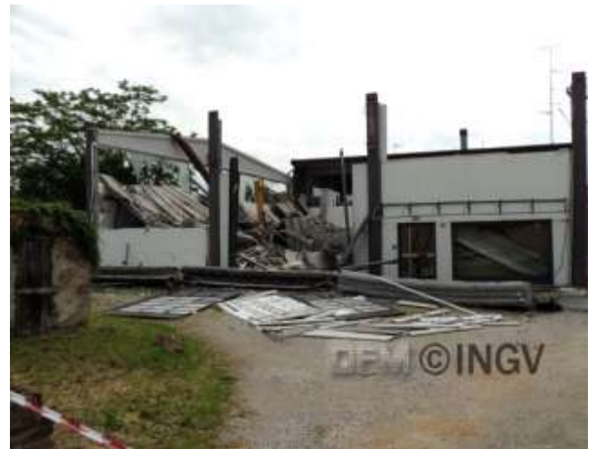
Foto 14. Sulla strada tra Dosso e Sant'Agostino Crollo ad un capannone industriale. Molti danni simili si sono verificati in tutta l'area