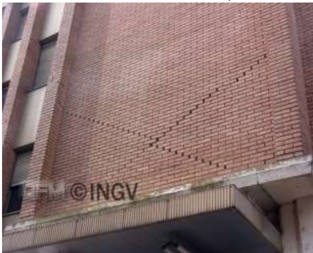
Foto 13. Cavezzo Danni di grado 3 in edificio in cemento armato