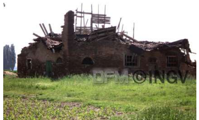
Foto 10. Pressi di San Carlo Crollo edificio di tipo A