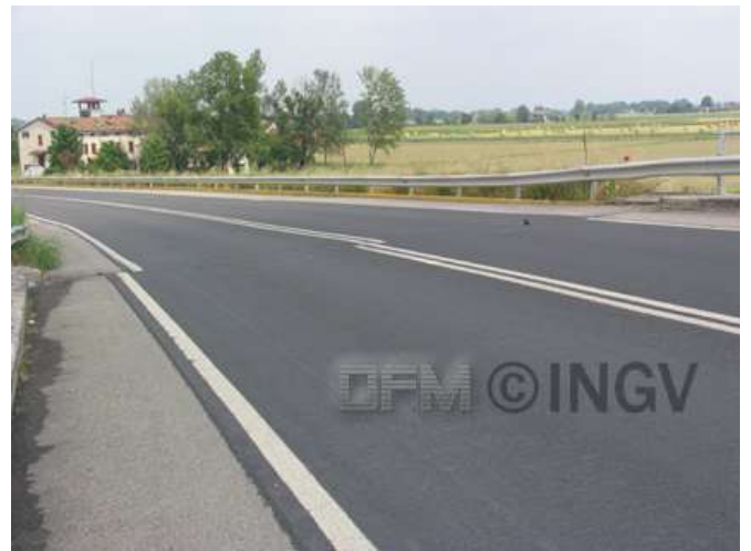
Foto 12. San Felice sul Panaro (vicinanze) Dislocazione manto stradale