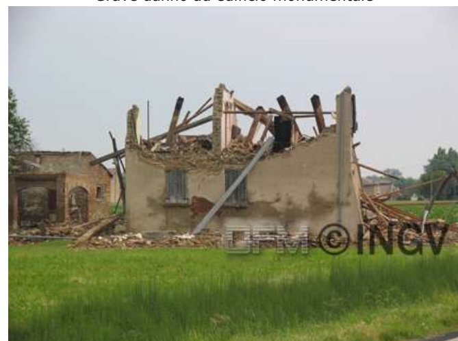
Foto 9. Sulla strada verso Alberone Crollo edificio di tipo A