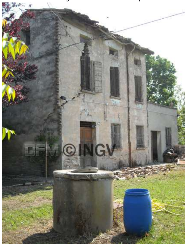
Foto 3. Canaletto Gravi danni in edificio vulnerabile di tipo A