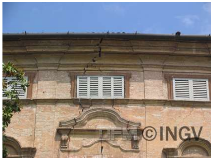
Foto 2. Finale Emilia Crepe larghe e profonde. Danno di grado 3 in edificio di tipo B