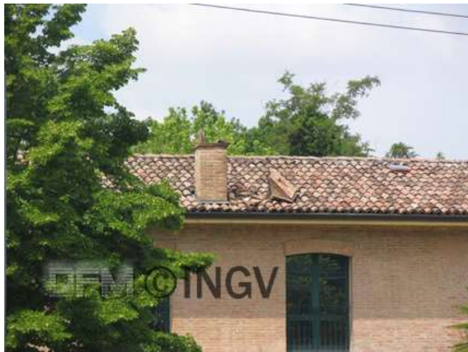
Foto 11. San Felice sul Panaro Rottura camino in edificio di tipo C