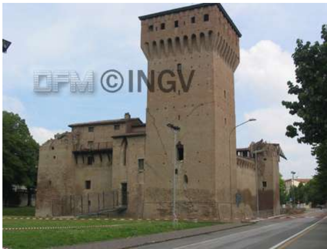
Foto 7. San Felice sul Panaro Grave danno ad edificio monumentale