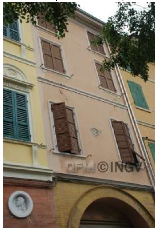
Foto 4. Mirandola Crepe diffuse (grado danno 2) in edificio di tipo B