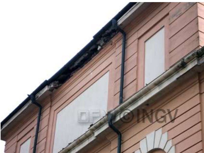
Foto 1. Concordia Sulla Secchia Caduta/cedimento di frontoni, cornicioni. Danno di grado 3 in edificio di tipo B

Seguono alcuni esempi di danno rilevato su alcune delle tipologie edilizie presenti sul territorio: