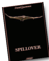
SPILLOVER L'ultimo libro di Quammen, sulle pandemie (Adelphi)

cora non si conosce il cruciale “ospite serbatoio”, cioè l'animale in cui si annida e riposa il virus. Com'è possibile? «Perché Ebola è il virus più misterioso degli ultimi decenni. Qualcuno ha accusato i pipistrelli, ma non c'è nulla di certo. Il virus “scompare” e poi riemerge all'improvviso. Di Ebola conosciamo solo la punta dell'iceberg».